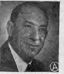
PRESIDENTE ORLICH...responde al gobierno panameño del Presidente Chiari...