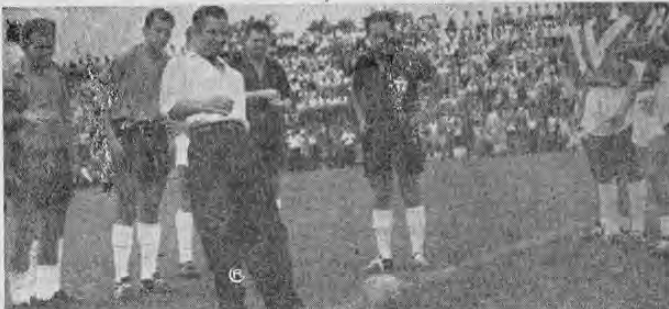
El glorioso rutero nacional Emilio Artavia, realizó el saque de honor del partido del domingo en el estadio manudo. Aquí lo vemos en el momento en que cumple con el toque al balón recibiendo la más cerrada ovación del público en general. Se le hizo así reconocimiento a su extraordinaria labor en la reciente Vuelta de Guatemala. Poco antes había sido condecorado por los directivos de la Liga Deportiva Alajuelense.