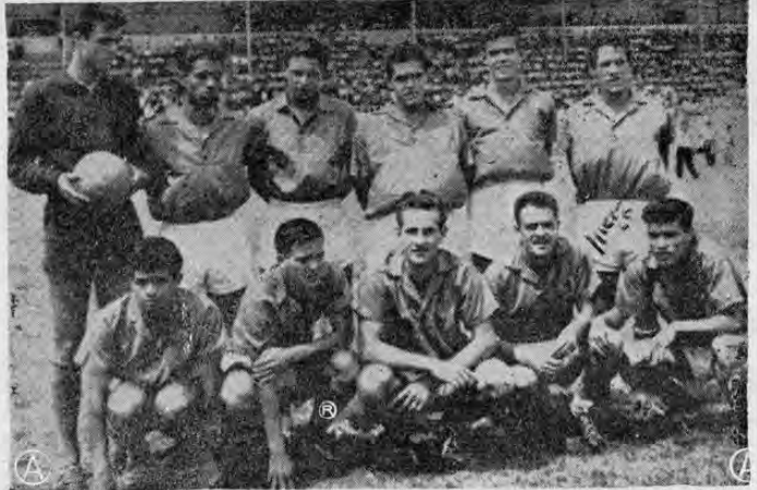
Orion en el tercer puesto del Campeonato Superior.

URUGUAY: Quesada, Vega Ayala y Williams; Chacón I y Chacón II; Bolaños, Ruiz, Tarcisio, Padilla y Elizondo.