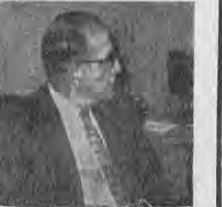
PRESIDENTE CHIARI...encuera una sublevación del...

MOSCÚ, 27 (AP) — Anussavan Arzumanyana de la Academia Soviética de Ciencias catalogó hoy al Mercado Común como "un imperio de Monopolios, en que los gigantes explotan a Millones de trabajadores". Arzumanyan pronunció el discurso de apertura en la Conferencia de Marxistas-Leninistas celebrada en Moscú para estudiar los países capitalistas. TASS dijo que 28 países estaban representados. Dijo que el Instituto de Economía Internacional y de Relaciones Internacionales en la Academia calculaba que 200 monopolios principales del mundo capitalista controlaban el 34.2 por ciento de toda la producción industrial de los países capitalistas. Refiriéndose al Mercado Común dijo que éste era incapaz de "evitar el deterioro de la situación económica y medios para resolver el problema de la colocación de los productos.